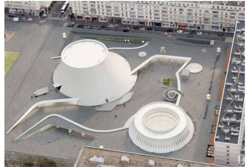
Site Niemeyer ©Deshoulières Jeanneau Architecte / groupe A5

Le site culturel du Volcan, confié à l'architecte brésilien Oscar Niemeyer, est le résultat d'un chantier de quatre ans (1978 – 1982). Niemeyer a pris le contrepied du projet attendu sur le site, un théâtre avec vue frontale sur un parvis. Il a pris en compte tout l'îlot et projeté son architecture faite de courbes/contrecourbes désaxées dans un mouvement ascendant, un objet sculptural comme contrepoinct à la rigueur géométrique du plan Perret. Son gabarit (environ 11 000 m 2 ) et son emplacement, en continuité du bassin du commerce, font de cet ensemble un lieu emblématique, visible et participant à l'une des perspectives majeures de la ville du Havre. En vision lointaine, le bâtiment Niemeyer offre une image forte inscrite dans un cadre remarquable, devenue depuis 30 ans une icône pour Le Havre. La rencontre Perret /Niemeyer fait de ce site un exemple unique de l'architecture du XXe siècle. Il fait partie du centre ville reconstruit du Havre, inscrit au patrimoine mondial de l'UNESCO depuis 2005.