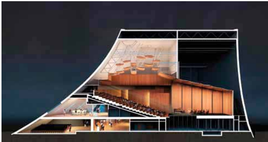
Coupe intérieure du Grand Volcan - configuration concert ©Deshoulières Jeanneau Architecte / groupe A5

L'objectif principal de restructuration du Grand Volcan, mis à disposition de la Scène nationale, est la réhabilitation de la grande salle, de sa scène et de ses accès. Cependant, l'ensemble du volume du Grand Volcan est impacté par la restructuration nécessaire pour la mise aux normes d'accessibilité et de sécurité incendie, l'apport d'une ambiance chaleureuse fortement demandée par les utilisateurs, et les besoins en apport de lumière naturelle.